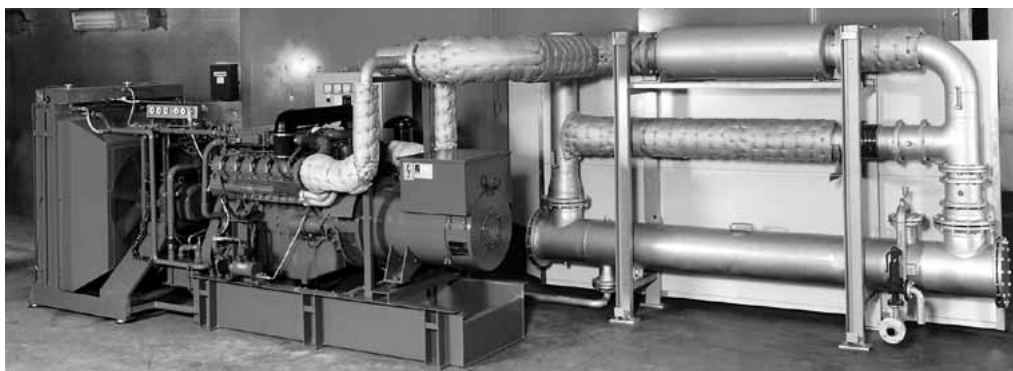
Рис. 2.23. Блочная теплоэлектростанция фирмы ABZ

Дополнительным источником тепла при работе дизель-генератора является тепло выхлопных газов. Их температура на выходе из